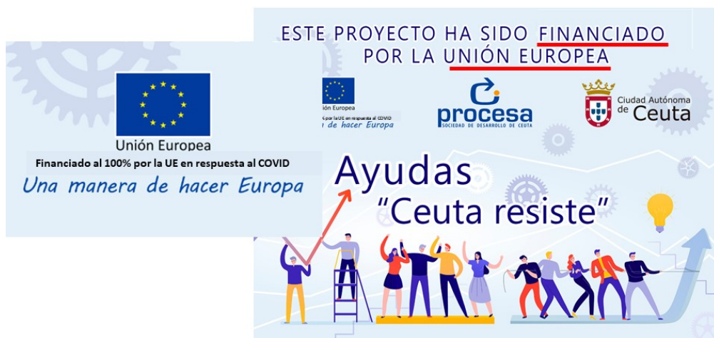
Imagen Programa “Ceuta Resiste”

Entrevista a la Consejera de Economía y Hacienda en TV local para explicar la línea de ayudas financiada al 100% por la Unión Europea