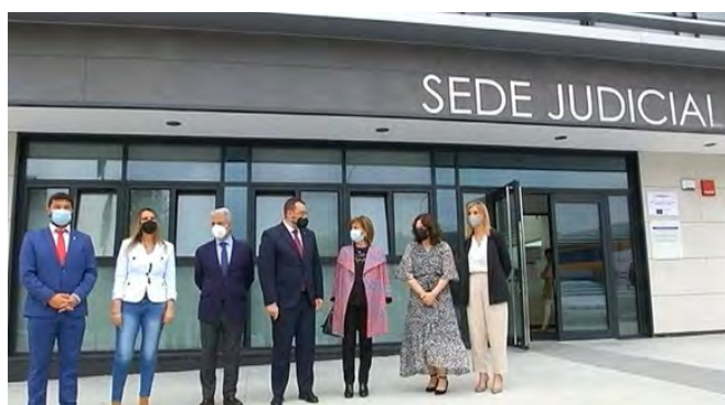
Acto de inauguración edificio de consumo energético casi nulo en Luarca

En el apartado de acciones de difusión se incluye la publicación de diversas noticias por parte de los medios de comunicación regional sobre los proyectos cofinanciados por FEDER que se han ejecutado en el último año, como los vinculados con la transición energética, ayudas a empresas, proyectos medioambientales, centros de salud y colegios.