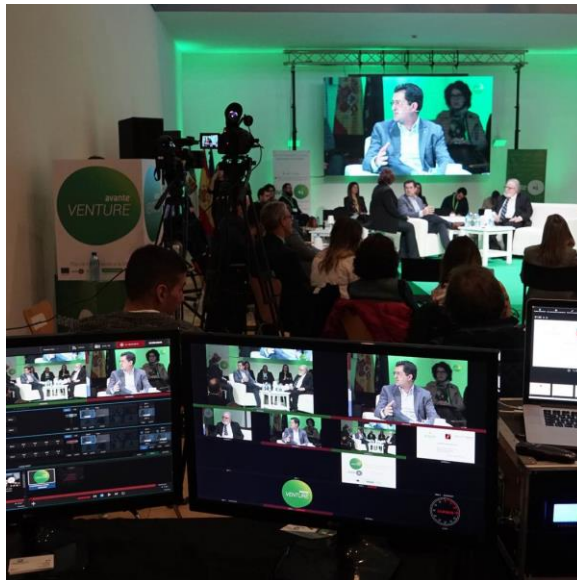
Retransmisión en streaming del Venture

Se proporciona un alto grado de cobertura entre tanto se hace una extensa difusión y, además de posibilitar la asistencia presencial al acto, se habilita una web para seguir vía streaming el mismo así como, con la grabación de píldoras (vídeo) y podcast (audio), se permite su reproducción a través de la Red en cualquier punto y a cualquier hora.