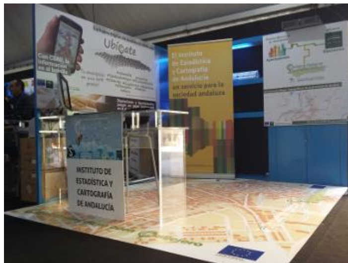
Presencia del IECA en la III Feria de Innovación y Nuevas Tecnologías en la Diputación de Sevilla

El IECA, en el ámbito de la difusión de sus actividades celebra numerosos actos. Asimismo, utiliza otros foros y eventos para dar a conocer su actividad. A continuación, se muestra documentación fotográfica sobre algunas de estas iniciativas donde se refleja la imagen de la UE: