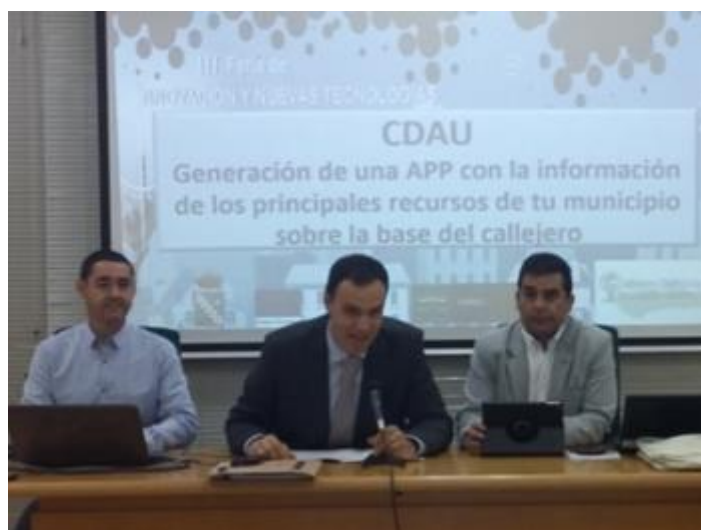
Charla "Generación de una APP con la información de los principales recursos de tu municipio sobre la base del callejero. Caso de éxito. Ayuntamiento de Casariche", en el contexto de la III Feria de Innovación y Nuevas Tecnologías en la Diputación de Sevilla