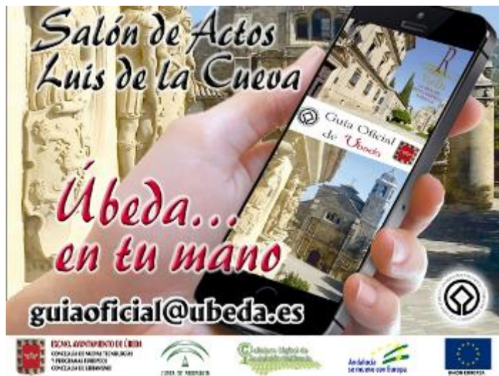
Presentación APP Guía Oficial de Úbeda