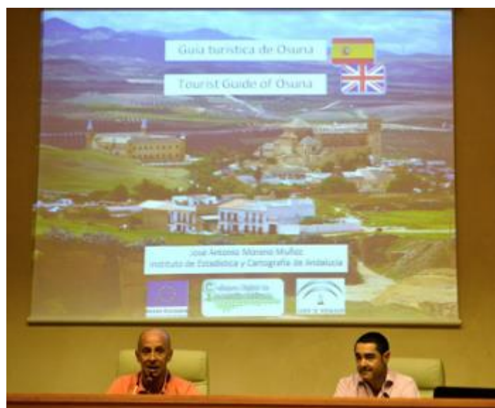
Presentación de la nueva aplicación para móvil “Guía turística de Osuna”