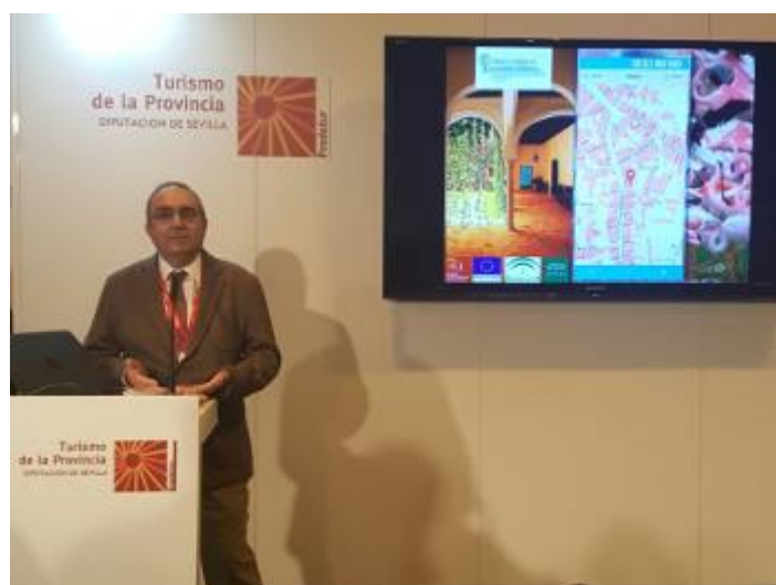
Presentación de la aplicación "Callejero Turístico de la Provincia de Sevilla" en FITUR 2017