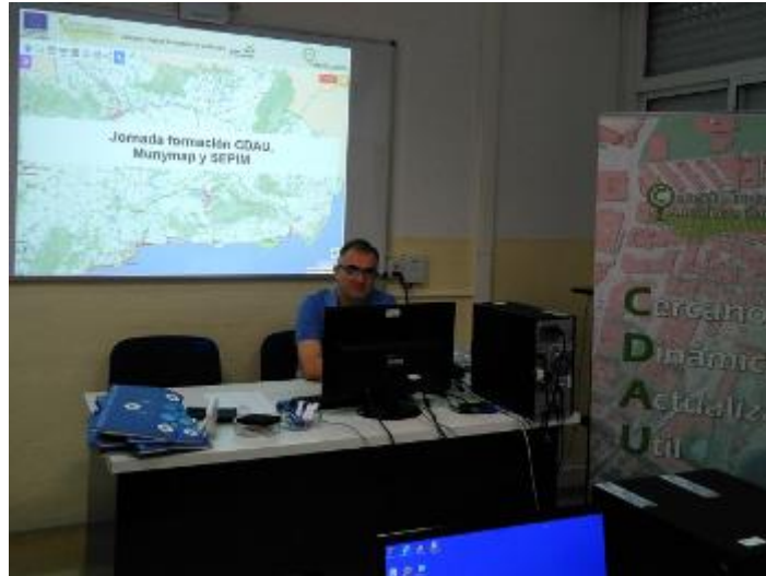
Jornada técnica en Almería